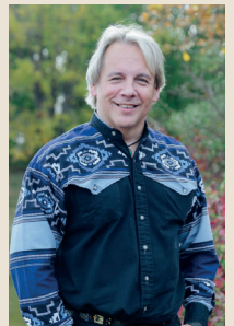
Drew Hayden Taylor

Drew Hayden Taylor von der Curve Lake First Nation , wo er bis heute lebt, ist ein preisgekrönter Dramatiker, Romanautor, Filmemacher und Journalist aus Kanada. Er bewegt sich locker zwischen Stand-up im Kennedy Center und der künstlerischen Leitung von Native Earth Performing Arts. Als Autor von 36 Büchern ist er derzeit auf Europatour mit seinem Thriller »COLD«. Wir freuen uns auf einen unterhaltsamen Abend, wo es vor allem um seinen erfolgreichen Film »Searching for Winnetou« geht, in dem er mit Witz und Tiefgang die deutsche Faszination für »Indianer« beleuchtet.