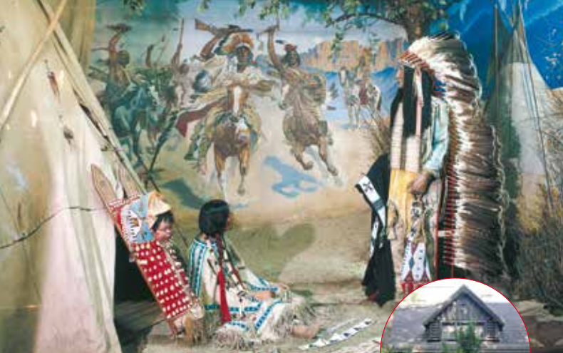
Indianie Ameryki Północnej