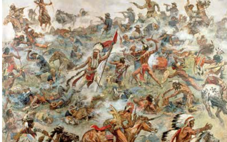
bitwa nad Little Bighorn