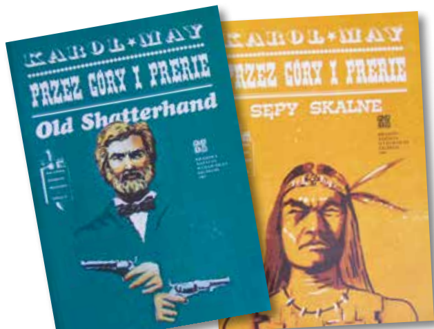
polskie edycje książek Karola Maya